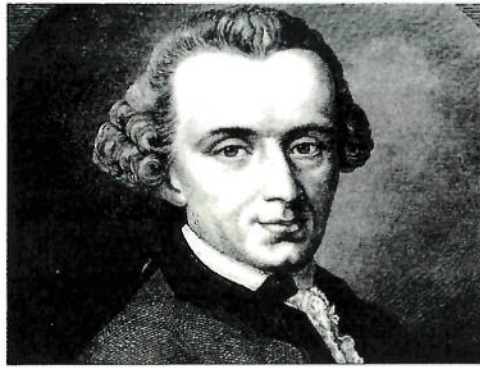
Immanuel Kant (1724–1804)