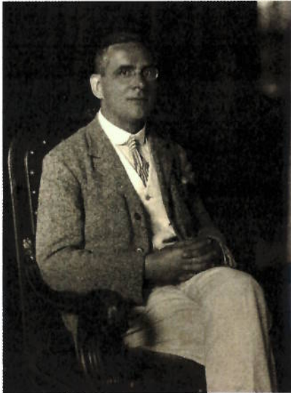
Moritz Schlick (1882–1936)