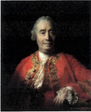
David Hume (1711–1776)

+10. Esittele metafysiikan vastustajia länsimaisessa tieteessä ja filosofiassa sekä pohdi heidän perustelujaan.