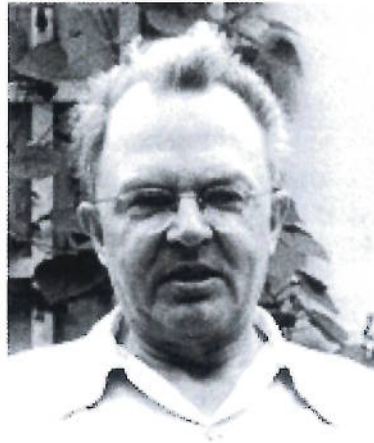
Rudolf Carnap (1891–1970)